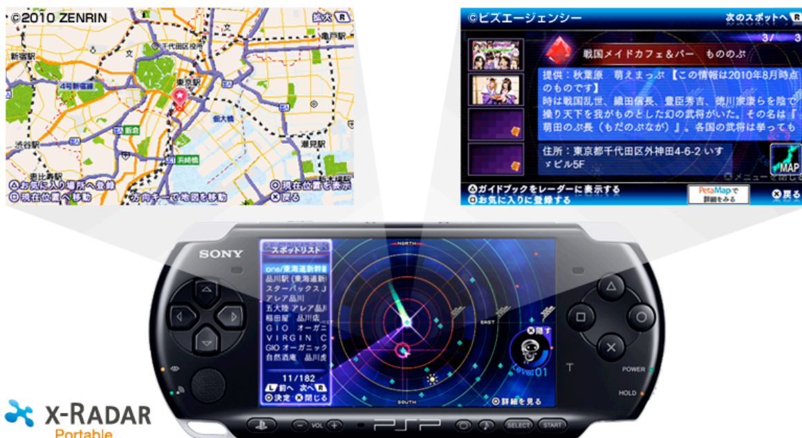
x-Radar Portable 画面イメージ

「x-Radar Portable」とはソニーのオンライン地図サービス「PetaMap(ペタマップ)」( http://petamap.jp )に登録されたグルメ、観光、無線 LAN スポット、PS スポットなど約 80 万件のスポット情報の中から、ユーザーの現在地周辺のスポットを検索できる無料の PSP®専用アプリケーションです。レーダー型のインターフェースにより直感的な方向ナビをお楽しみ頂けます。