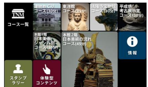
『トーハクナビ』アプリ画面イメージ

プロジェクトサイト URL : http://webarchives.tnm.jp/archives/contents/23