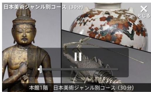
日本美術ジャンル別コース画面

■アプリ紹介動画 URL: 日本語版 http://youtu.be/3VZ3jr6orLg 英語版 http://youtu.be/mBBuHpMqBg