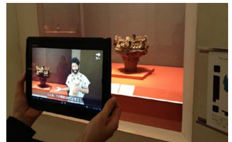
AR技術を利用した「トーハク劇場コース」の様子

「トーハク劇場コース」では、館内に設置されたARマーカー(CyberCode ® )に端末のカメラをかざすと、バーチャルな俳優が現れ、演劇仕立てのガイド映像が流れます。映像コンテンツは、昨年夏に同博物館で開催された子供およびファミリー向けのガイドツアーをベースにしたもので、「縄文・祈りの造形」「仏像に託された祈り」「近代絵画・作者の表現としての作品」の3つが収録されています。