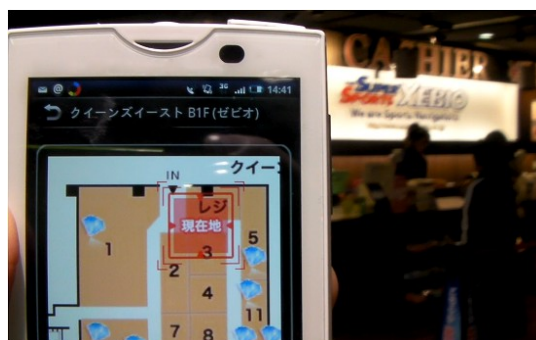
『スマートショッピング』体験イベントイメージ

*ご参考: www.koozyt.com/press/2011/pr110128.html