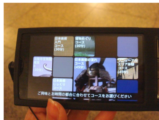
『とーはくナビ』イメージ

*ご参考: www.youtube.com/koozyt#p/a/u/2/cw_S8H9fRpA