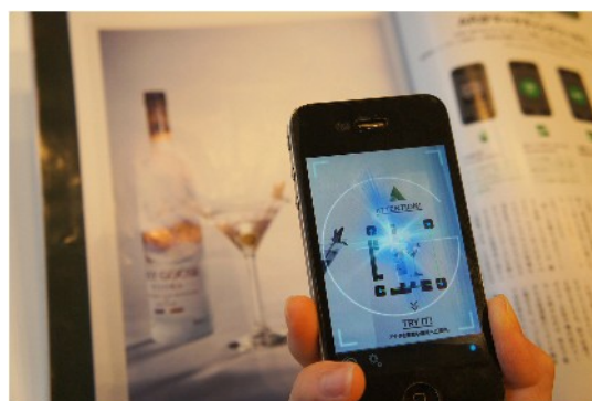
『GnG(GET and GO)』イメージ

*ご参考: 「GnG」サービス www.youtube.com/user/koozyt#p/u/9/4sGEaTjLcKw