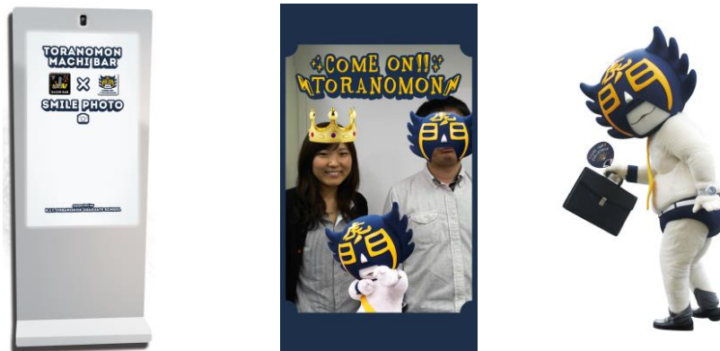
「SMILE PHOTO」笑顔認識サイネージイメージ(左)、カモ虎課長フレーム(バトルモード)(中央)、虎ノ門ご当地キャラクター「カモ虎課長」(右)

「SMILE PHOTO」では、虎ノ門ご当地キャラクターである「カモ虎課長」や「虎ノ門街バル」のフレームで記念写真が楽しめるほか、複数人での体験の場合、「カモ虎課長笑顔バトル」モードとなり、笑顔度の高い人には王冠、笑顔度の低い人には、カモ虎課長のマスクが被せられてしまいます。また、「カモ虎課長フレーム」限定アタリフレームが出たら、先着3名様に「カモ虎課長トートバック」のプレゼントを予定しています。一方、「DF.sensor」による街回遊性行動調査では、「DF.sensor」を「SMILE PHOTO」体験付近、およびあらかじめサンプリングされた街バル参加店舗(5か所程度)に設置し、イベント期間中および前後での時刻毎のユーザ推移や滞留分布、多地点間の移動ユーザ割合などを計測します。