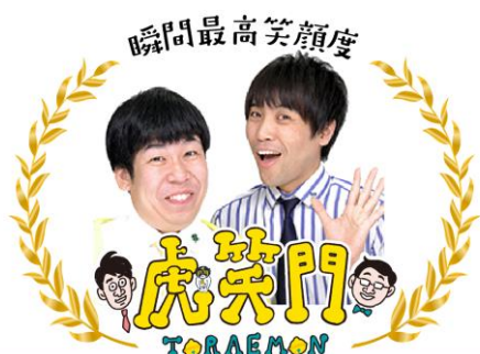
■瞬間最高笑顔度を獲得したお笑い芸人シャイニングスターズ