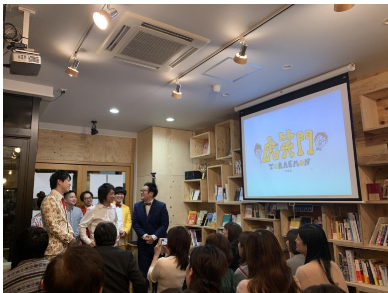
■ イベント中の会場の様子：採点結果を確認中

今回第5回目を迎える「虎笑門チャンピオン大会」では、これらの優勝4組が集結。MCに三拍子、スペシャルゲストにエルシャラカーニ、前説には、地元、虎ノ門のご当地キャラクターのカモ虎課長と係長、さらにフリーで活動中のトリオの「あはは」も出演予定。イベント終了後は、芸人との懇親会も行う予定。